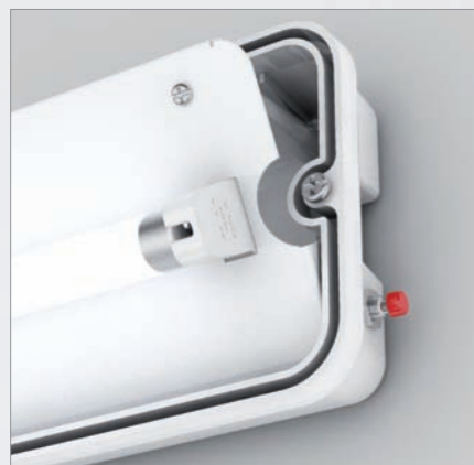
Łatwy dostęp dzięki uchylnej płycie montażowej Easily accessible with lifted mounting plate