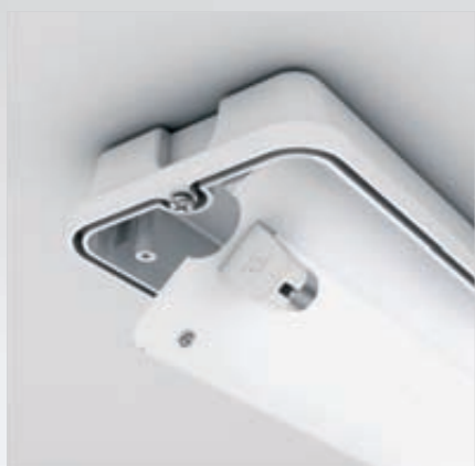
Łatwy dostęp dzięki uchylnej płycie montażowej Easily accessible with lifted mounting plate