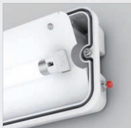
Łatwy dostęp dzięki uchylnej płycie montażowej Easily accessible with lifted mounting plate