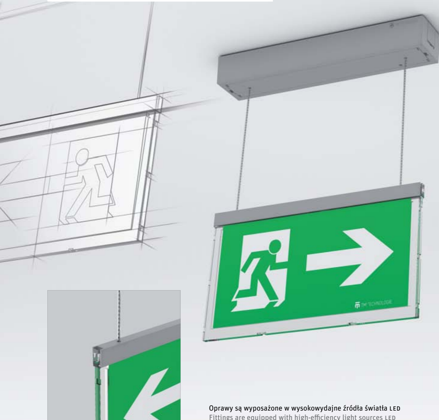
Oprawy są wyposażone w wysokowydajne źródła światła LED Fittings are equipped with high-efficiency light sources LED

Double-sided evacuation lighting fittings with the protection level IP20, made of polycarbonate (PC). They are designed to indicate exits and evacuation routes in public buildings. As light sources, the LED diodes were applied. During emergency operation, light sources operate with 100% luminous flux.